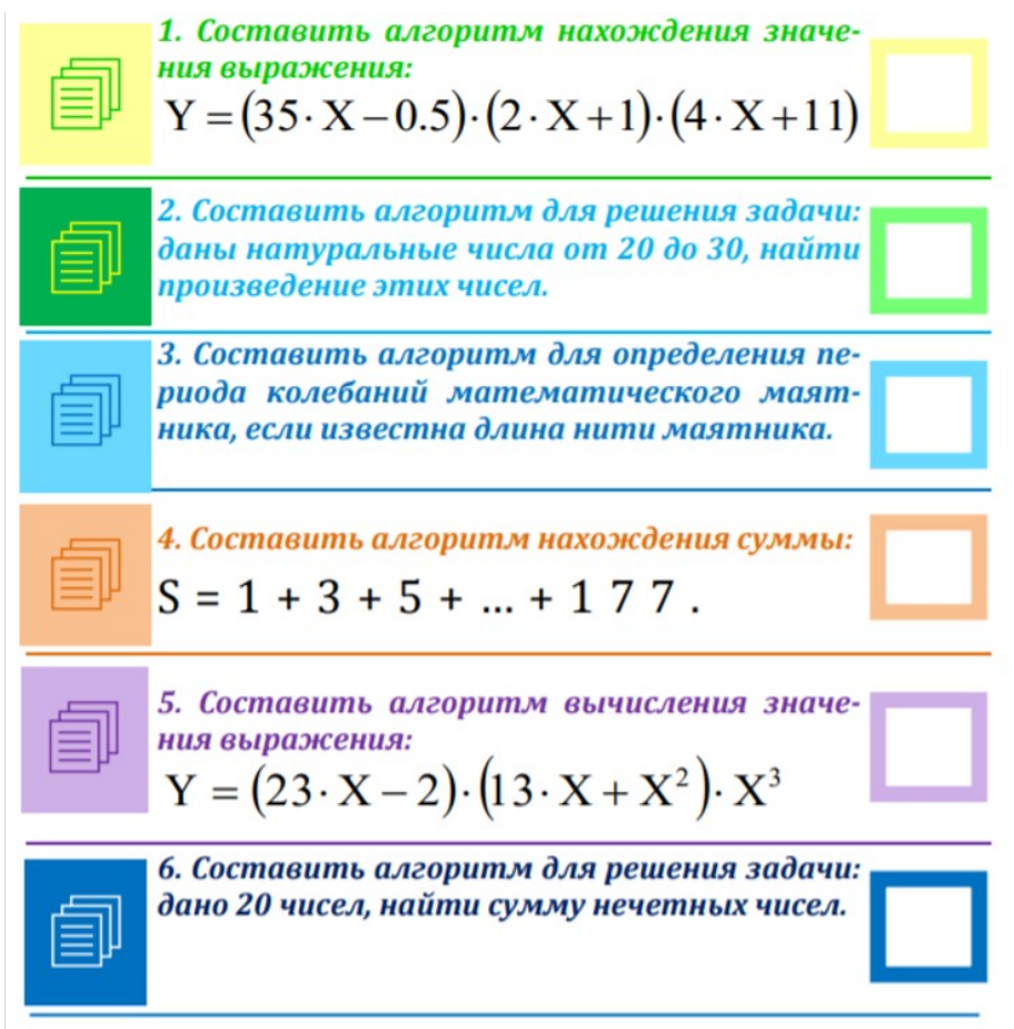
Рисунок – Образец задания

В текстовом редакторе создайте документ, включая все рисунки, формулы, учитывая особенности форматирования. Выполните следующие установки: поля: верхнее – 1,5 см, нижнее – 1,5 см, левое – 2,5 см, правое – 1,5 см; междустрочный интервал – одинарный; абзацные отступы и выступы, если в этом есть необходимость. Подберите подходящий тип и размер шрифта, максимально соответствующий образцу.